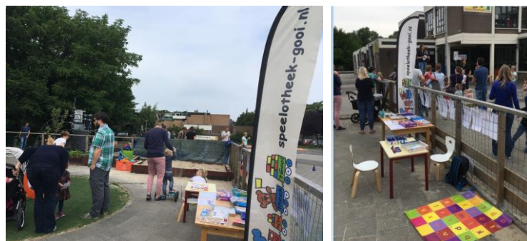
Op de tafeltjes buiten stond het speciaal geselecteerde speelgoed klaar

Onze deelname aan de speelochtend was beide partijen zo goed bevallen dat we ook 16 juni met de speelochtend mee hebben gedaan, dit keer op de speelplaats van peuterspeelschool 't Startblok. We hadden een mooie plek bij de zandbak en zo kon er veel van ons buitenspeelgoed uitgeprobeerd worden. Ook was er een keuze gemaakt uit ons materiaal voor binnenshuis dat paste bij de doelgroep. De aanwezige kinderen konden aan de klaargezette tafeltjes buiten de uitdaging ervan ervaren die dit speelgoed voor hen heeft. Voor veel ouders was het een eye-opener dat er zoveel materiaal bij ons voor hun kind aanwezig is. Een aantal van hen is meteen lener geworden. De ouders die al lener waren, kregen vooral aanvullende informatie. De gezellige sfeer, het mooie weer, de inzet van onze vrijwilligers; dit soort evenementen zijn een goede aanvulling op onze activiteiten.