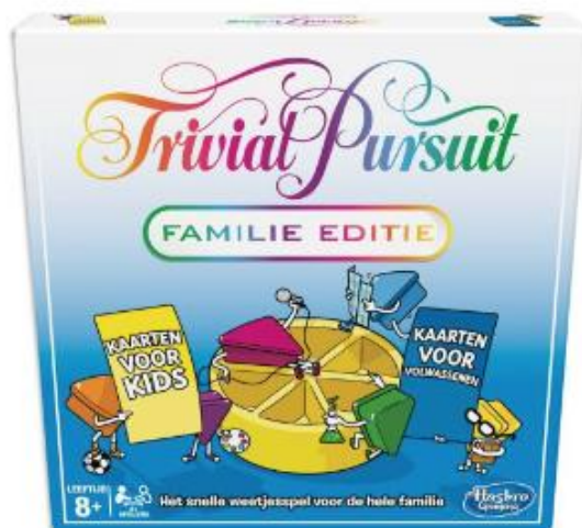
FIGUUR 5 TRIVIAL PURSUIT