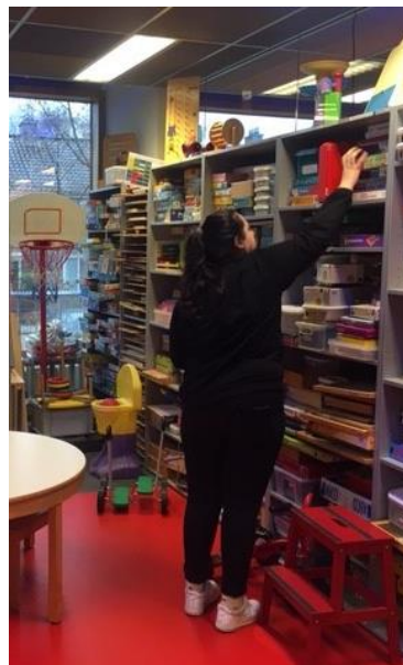
Onze stagiair bekijkt het speelgoed

Beide stagiairs hebben ons fantastisch geholpen en het is leuk om te zien hoe positief zij de werkzaamheden oppakten.