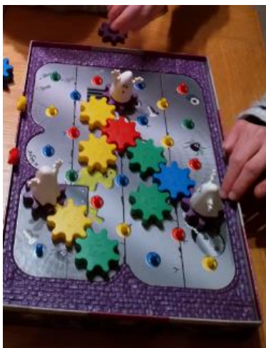
Chaos in het spookhuis

Het aantal stuks materiaal dat is uitgeleend laat een daling zien van 7%; het daalt van 1714 stuks in 2017 naar 1592 stuks in 2018. Dat komt voornamelijk doordat leners minder materiaal meenemen. Wat verder opvalt is dat in 2017 de puzzels nog behoorlijk in de lift zaten, terwijl in 2018 dat vooral het constructiemateriaal (+41%) en de muziekinstrumenten (+47%) zijn.