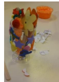
Lekker knutselen met z'n allen in De Speeltrein