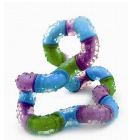
2 soorten Tangle