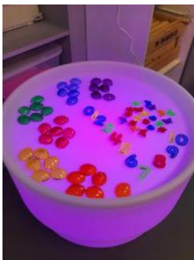
FIGUUR 4 LICHTTAFEL