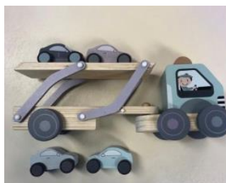
FIGUUR 1 HOUTEN TRANSPORTER