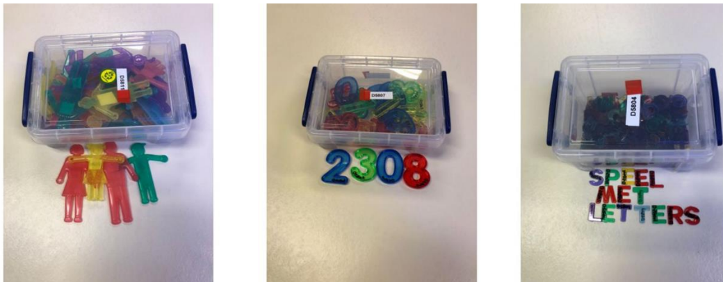
FIGUUR 3 MENSEN - CIJFERS - LETTERS TRANSPARANT

Ook zijn we in het najaar van 2022 naar de Kindvak geweest. Kindvak is een tweejaarlijks evenement gericht op primair onderwijs en speelgoed. We hebben hier kennis genomen van nieuw ontwikkelings speelgoed.