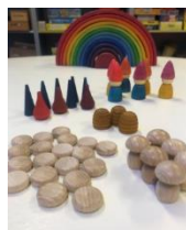
FIGUUR 2 SPEELKABOUTERS (HOUT)

De vrijwilligerscentrale is een belangrijke sparringspartner voor de Speel-o-theek. Wij krijgen regelmatig tips van hen en kunnen daar met vragen terecht. In 2022 is de vrijwilligerscentrale betrokken geweest bij onze verbetersessies. Hierdoor hebben wij als Speel-o-theek onze missie en doelen voor de komende jaren geactualiseerd. Een substantieel aantal van onze vrijwilligers komt bij ons via de website van de vrijwilligerscentrale: Huizenvoorelkaar.nl .